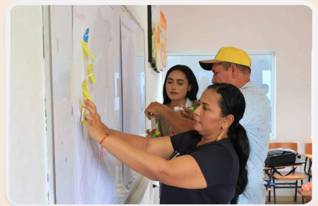
Ejercicios de actualización y priorización de la ACTA 2024